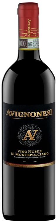
Vino Nobile di Montepulciano DOCG Avignonesi

Weinausbau: 12 Monaten im Barrique & 12 Monate auf der Flasche gereift