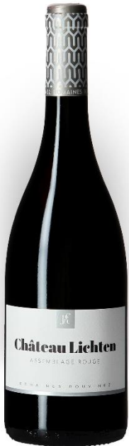
Château Lichten Rouge AC Domaines Rouvinez