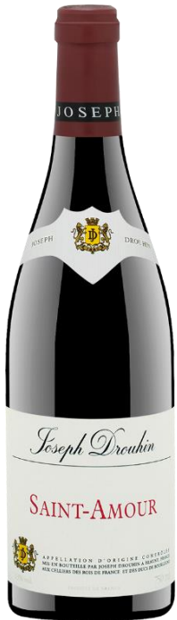
Saint-Amour AOC Joseph Drouhin