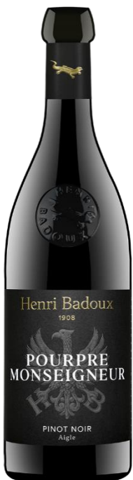
Aigle Pourpre „Monseigneur“ Chablais AOC Henri Badoux