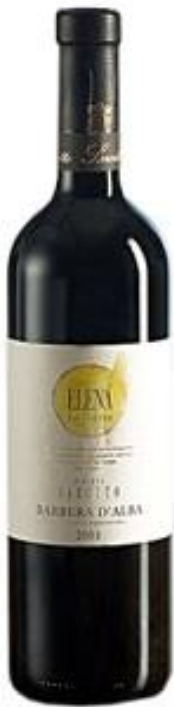
Barbera d'Alba Superiore DOC "Elena" Roberto Sarotto