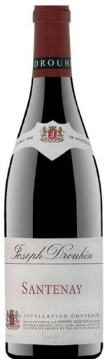
Santenay AOC Joseph Drouhin

Weinausbau: 8 Monaten im Pièce (Holzfass von 228 Litern)